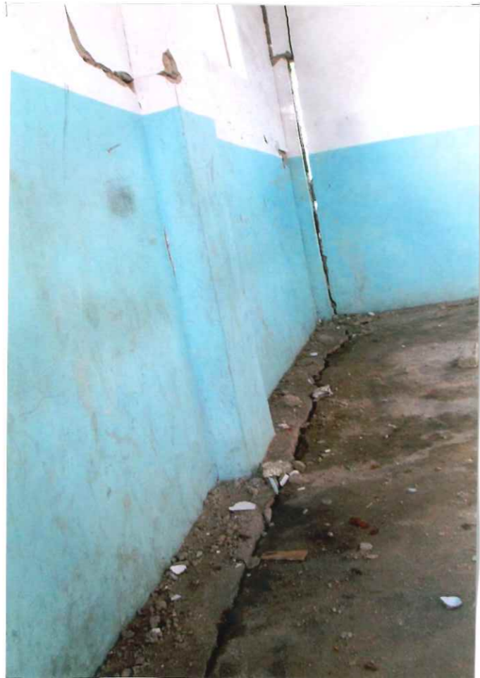
地震でダメージを受けた教室の内側