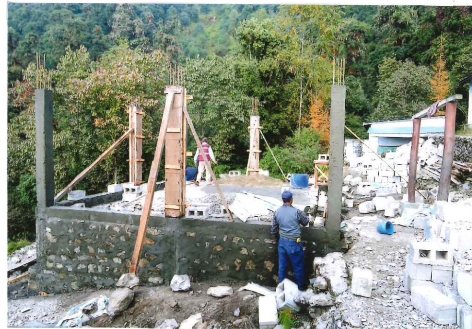
解体後、再建工事開始