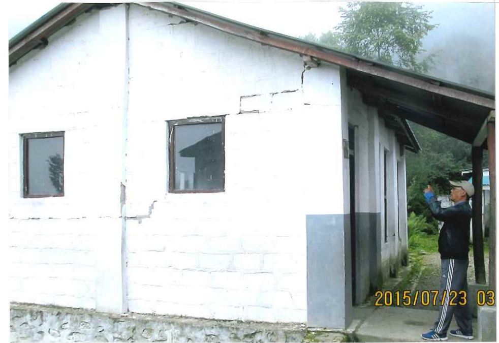
地震でダメージを受けた教室の外側